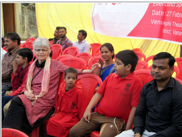
En attendant l'ouverture des Jeux Olympiques