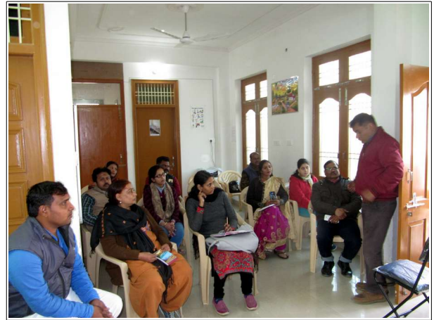
Atelier sur l'Intégration Sensorielle chez l'enfant avec autisme