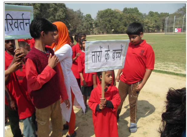
Chaque groupe d'enfants des différentes institutions en cortège

Notre école a un certain retentissement aussi auprès de l'université de Varanasi, puisque nous avons actuellement en stage une étudiante pour son projet de recherches et doctorat en lien avec l'autisme, et nous avons reçu une demande de stage d'une psychologue clinicienne encore en formation.