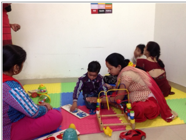
Les petits avec leurs mamans

A ce jour, nous avons le groupe régulier des cinq enfants de 7 à 13 ans et un groupe tout neuf de quatre jeunes enfants (entre 3 et 6 ans) avec les mamans deux fois par semaine pour un programme d'intervention précoce (avec l'intention à la demande des mamans de progressivement couvrir les cinq jours d'accueil).