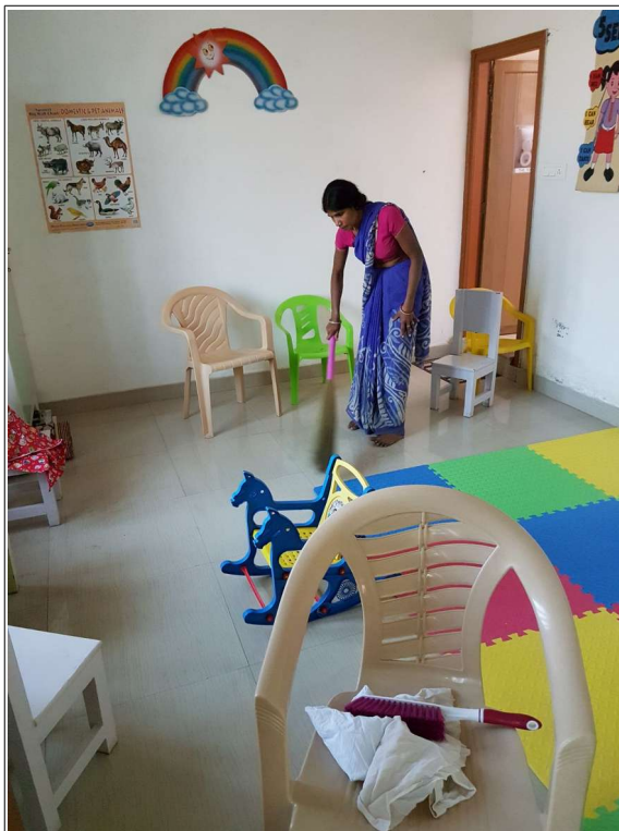
Le ménage dans la pièce des petits