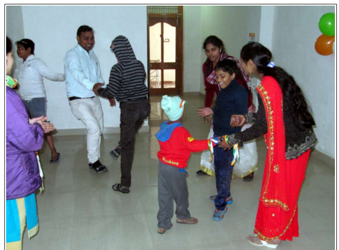
26 janvier, jour de la République et fête nationale en Inde

Notre page internet: www.taarokebacche.org