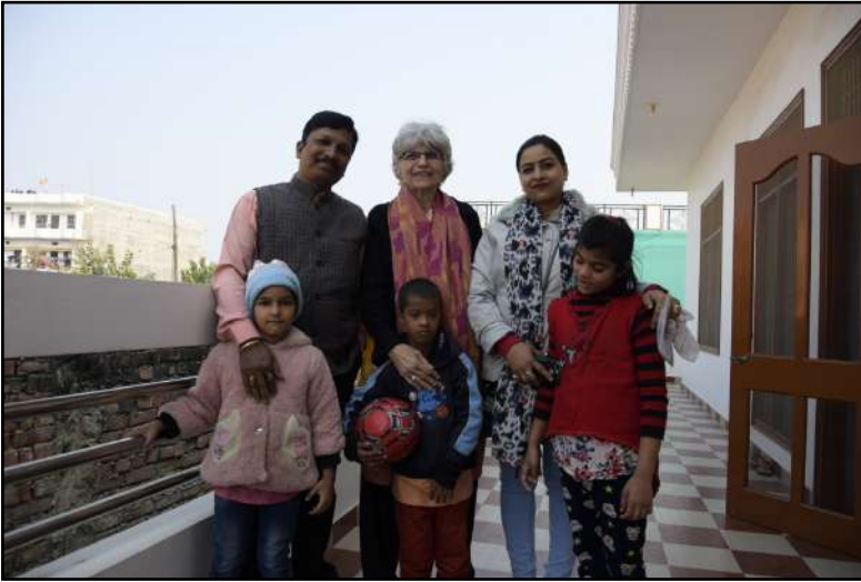
Visite de la famille d'Aryan