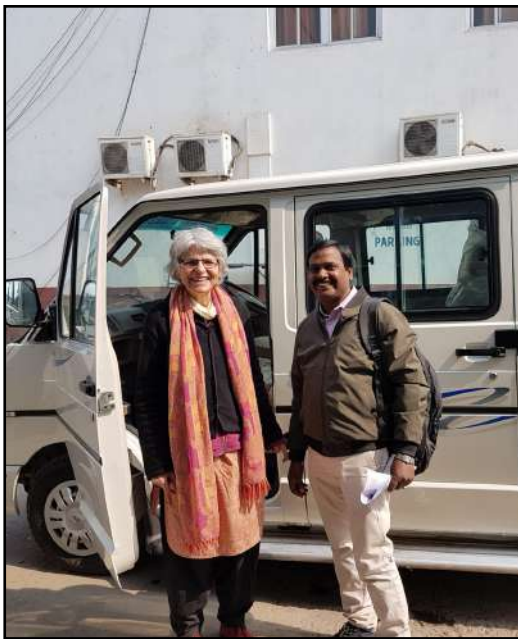
Enfin un nouveau bus ! Notre Tata Winger

• A la mi-décembre 2019, Surya Baudet, photographe de Chêne-Bourg, nous a rendu visite pendant cinq jours. Elle a pu ainsi réaliser de magnifiques photos des enfants. Nous la remercions vivement de sa présence.