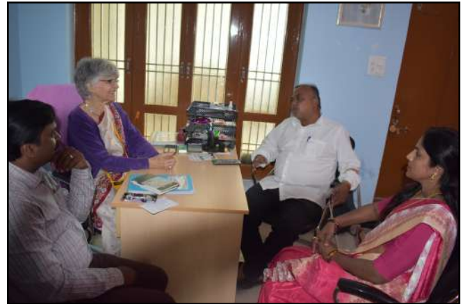
Visite du médecin homéopathe et politicien du gouvernement indien, 29 novembre