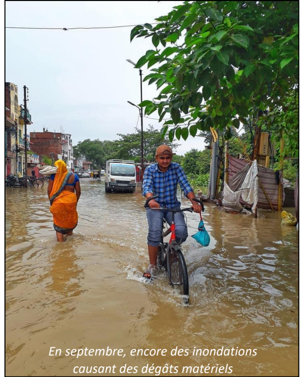
En septembre, encore des inondations causant des dégâts matériels