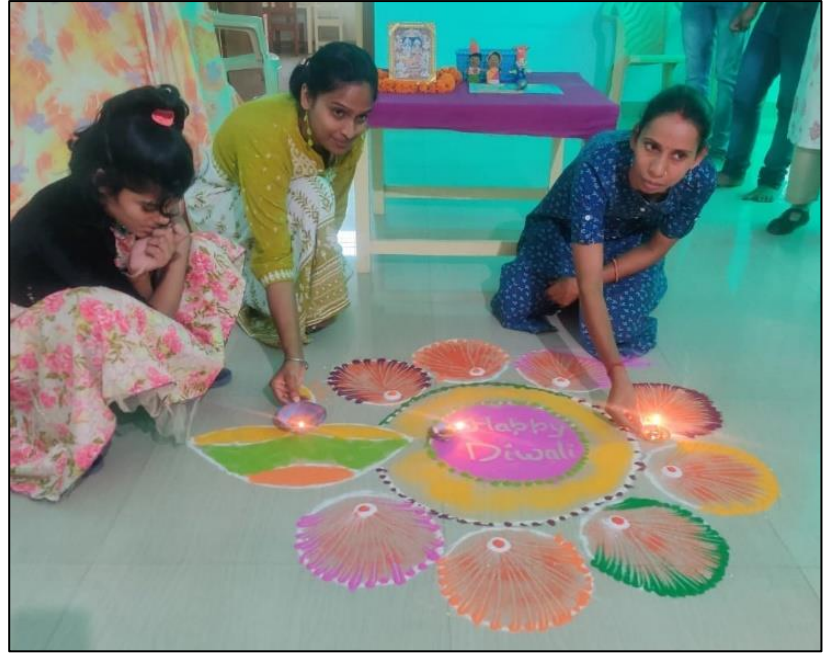
Diwali, la fête des lumières et des Rangolis